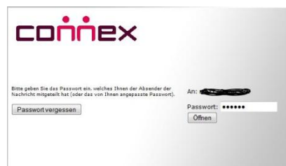
Abbildung 2: Passwordeingabe

Es ist von Ihrem Computer (PC, Macintosh ...), Betriebssystem (Windows, Mac OS, Linux ...) und den verwendeten Programmen (Internet Browser, Mailprogramm ...) abhängig, wie die verschlüsselte Mail bei Ihnen angezeigt wird.