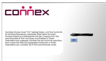
Abbildung 1: Die Anlage in Ihrem Internet Browser geöffnet

In den beiden folgenden Abbildungen sehen Sie eine Anlage die im Internet Browser geöffnet wurde.